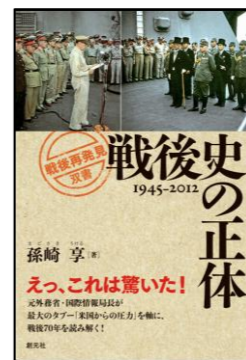
戦後史の正体 孫崎享/著 創元社

わたしのおすすめの本は「戦後史の正体」です。“米国からの圧力”を軸に戦後70年を読み解いた本で、新聞やテレビとは違う視点から日本の近代史が分析されています。