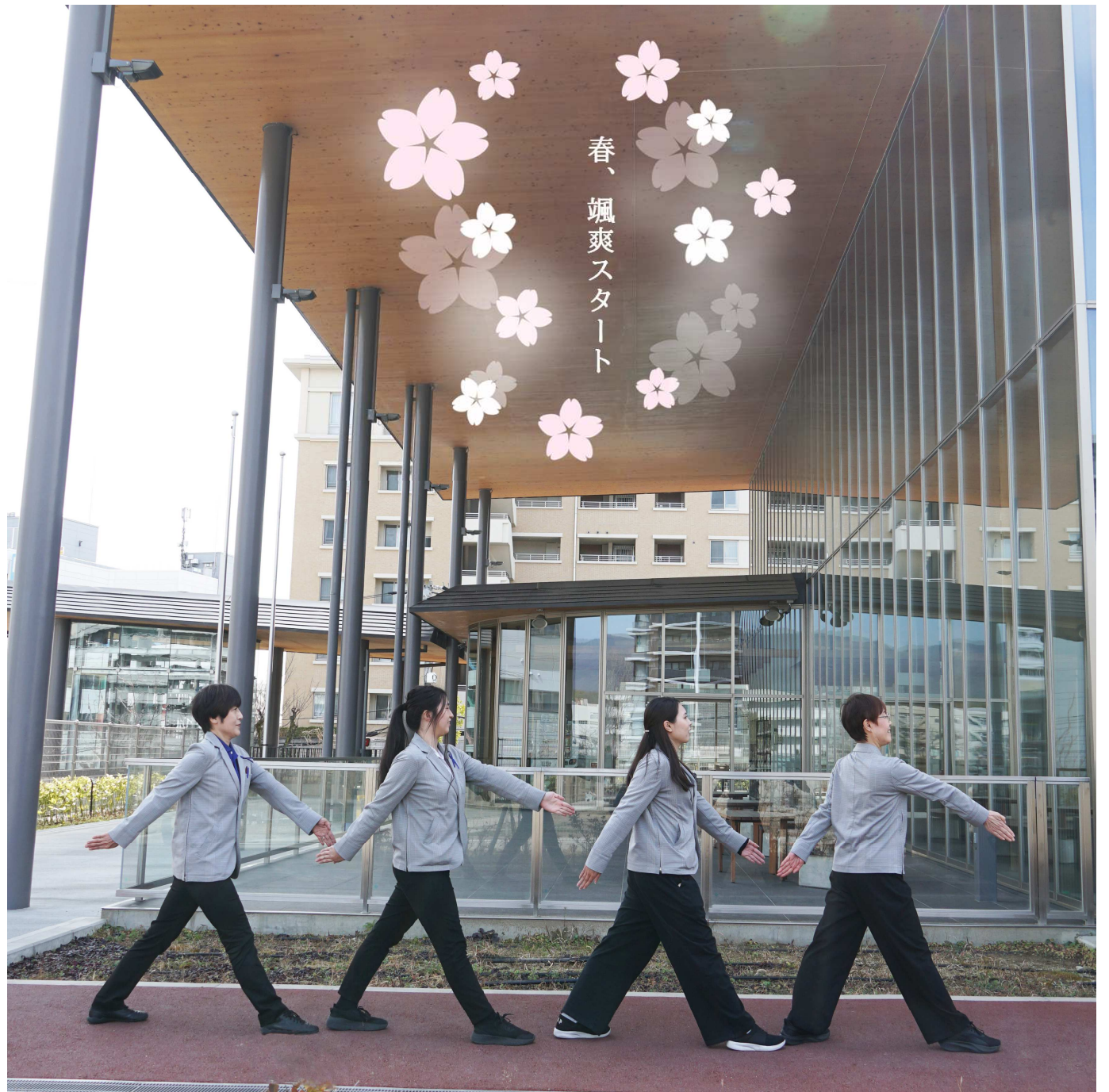
今月の表紙「まちきたロード！」