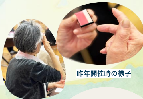
昨年開催時の様子