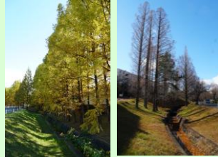
秋の様子 冬の様子