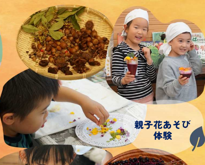
親子花あそび 体験