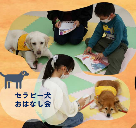
セラピー犬 おはなし会

たくさんの方にご参加いただきありがとうございました！各イベントの様子はInstagramでご覧いただけます。