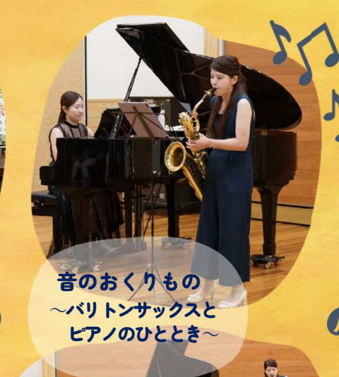
音のおくりもの ～バリトンサックスと ピアノのひととき～