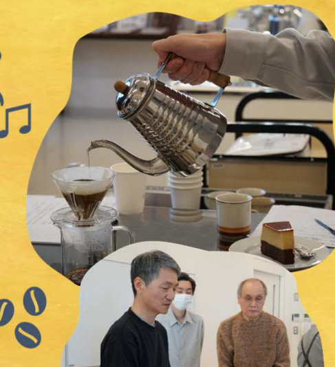
コーヒー講座 COFFEE BREAK を楽しもう