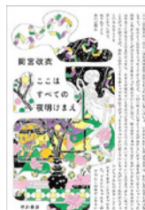
ここはすべての夜明けまえ 間宮 改衣/著 早川書房

最近読んで面白かったのは間宮改衣の「ここはすべての夜明けまえ」です。ジャンルのSFなのですが、かなり複雑な心理描写や感情が入り乱れる作品で、SFの枠に収まりきらない文学作品といった印象で読み応えがあります。平仮名表記が多い作風は「アルジャーノンに花束を」のオマージュがあるのかもしれません。