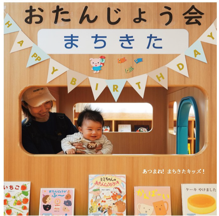
あつまれ! まちきたキッズ!

お兄さんのおたのしみ会 日 時: 5/4 (土) 14:00-14:30 場 所: 1階 乳幼児室 対 象: 幼児・小学生 申 込: 不要 昨年好評だった図書館、児童センターの男性スタッフによるワクワクドキドキのおはなし会です♪どんな絵本が登場するか楽しみに来てくださいね。 回想法カフェ 昔の新聞記事・映像で脳トレ! ～昭和40年代編～ 日 時: 5/6 (月祝) 14:00-15:00 場 所: 2階 視聴覚室 定 員: 15名 ※先着順 申 込: 電話・申込フォーム 受付期間: 4/10(水)～定員に達し次第終了 読売回想法DVDで大阪万博の頃を観ながら、クイズや思い出話で楽しく盛り上がりましょう! おはなしのひ 日 時: 5/27 (月) 11:30-12:00 場 所: 1階 集会所 対 象: 乳幼児 申 込: 不要 毎月第4月曜日に開催している児童センターの児童厚生員による絵本の読み聞かせイベントです♪