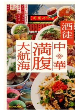
中華満腹大航海 酒徒/著 KADOKAWA

わたしのおすすめの本は「中華満腹大航海」です。現地に行かないと食 べられない料理の数々を写真豊富に紹介し研究し、レシピもつけてくれ ています。情熱が本から伝わってきて、現地に行きたくなります。とに かく美味しそう！