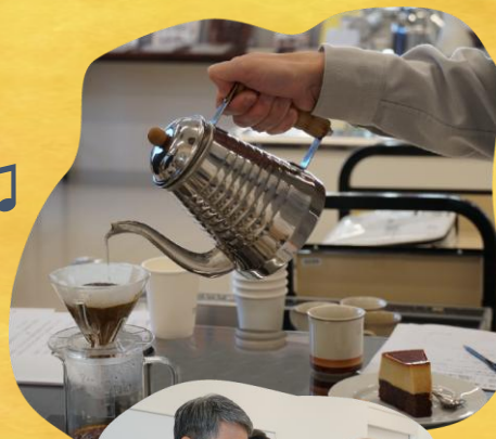
コーヒー講座 COFFEE BREAK を楽しもう