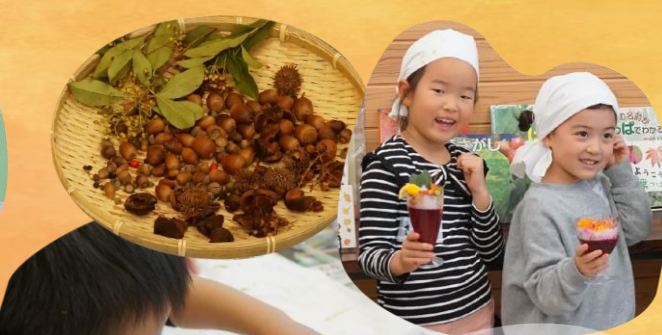
親子花あそび 体験