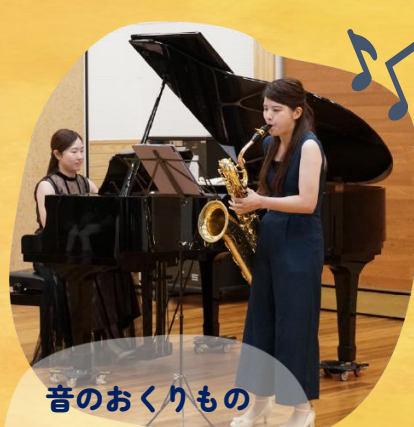
音のおくりもの ～バリトンサックスと ピアノのひととき～