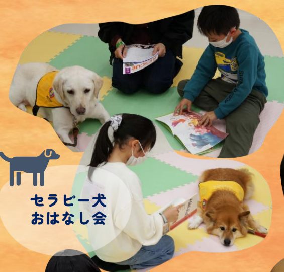
セラピー犬 おはなし会

たくさんの方にご参加いただきありがとうございました！各イベントの様子はInstagramでご覧いただけます。